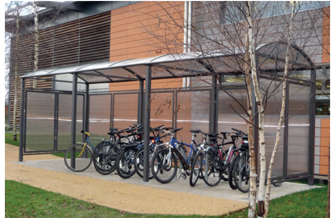
Art.-Nr. 529374 + 529041 + 529048