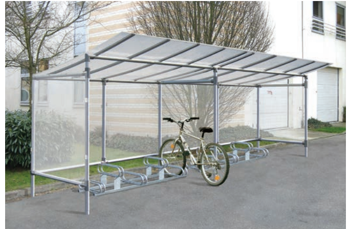
Art.-Nr. 529265 + 204719 + 529261 + 529271